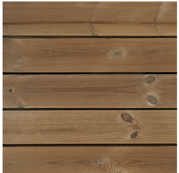
Termopuidust toodetel jälgida Thermoarena paigaldusjuhiseid